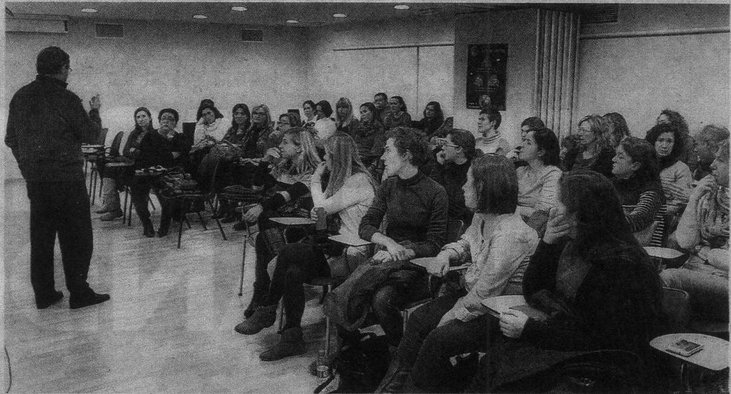
Opositores afectados por el parón judicial se asesoran el martes en el Colegio de Enfermería.

En el mismo frente combate la Conselleria de Sanidad. Desde el organismo autonómico defienden que la ley ampara al tribunal para cambiar a su antojo la nota con el fin de ajustarse al número de plazas. El propio conseller de Sanidad, Manuel Llombart, confirmó el lunes que la Generalitat ha recurrido la decisión judicial y mostró su temor a la dilatación del proceso en el tiempo.