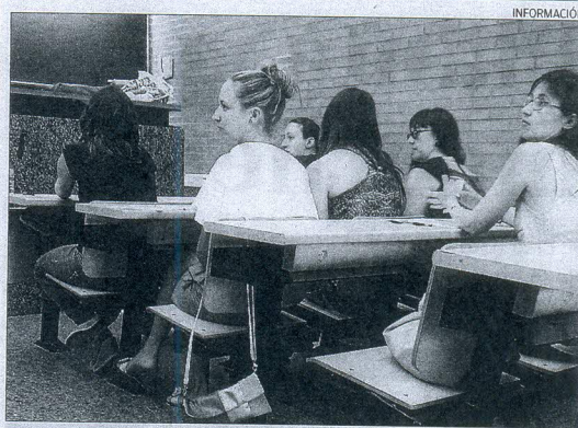
El hacinamiento marcó el desarrollo de la primera prueba.

■ Nació hace 24 años de la mano de profesionales que se dedicaban al estudio de las enfermedades del páncreas, que acordaron poner en marcha una red de investigadores y celebrar reuniones cada dos años. Yo empecé a coordinar el club en 2011, con el objetivo de crear unos estatutos y poner en marcha una asociación científica sólida que sirva para intercambiar conocimientos y ser interlocutores con la sociedad. Ahora tenemos estatutos y una junta directiva. La idea es reunirnos cada dos años para hacer cursos, tener becas de investigación y servir de portavoz a la sociedad para explicar la prevención de estas enfermedades.