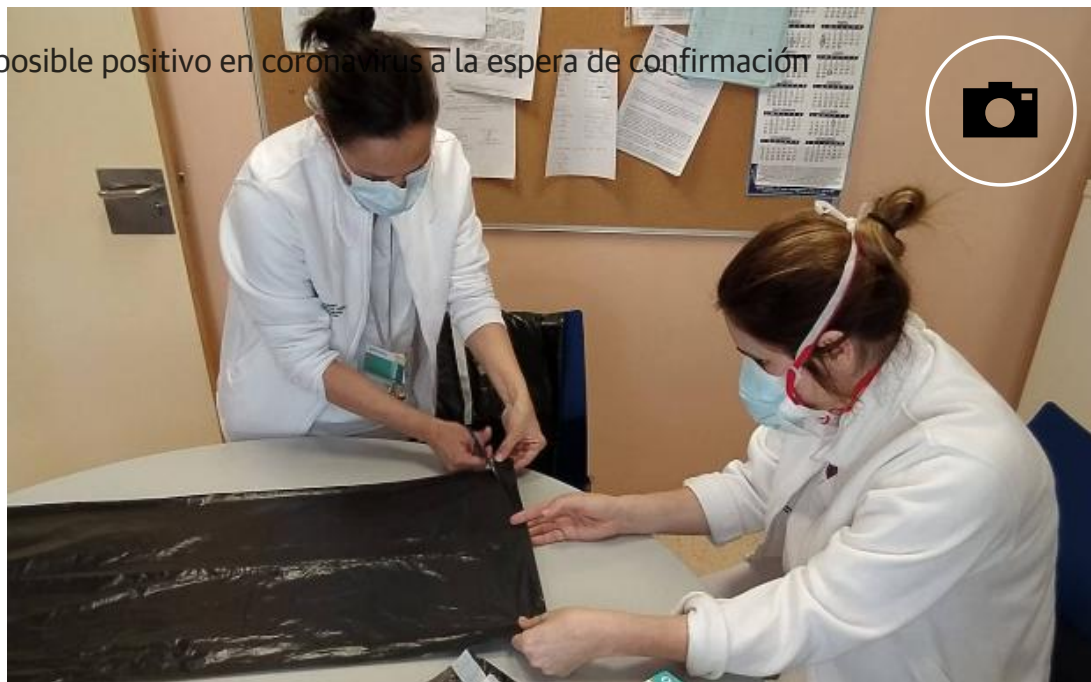
Enfermeras de Radiología del Hospital General de Valencia preparan protecciones con bolsas de basura.

Última hora. Fernando Simón, posible positivo en coronavirus a la espera de confirmación