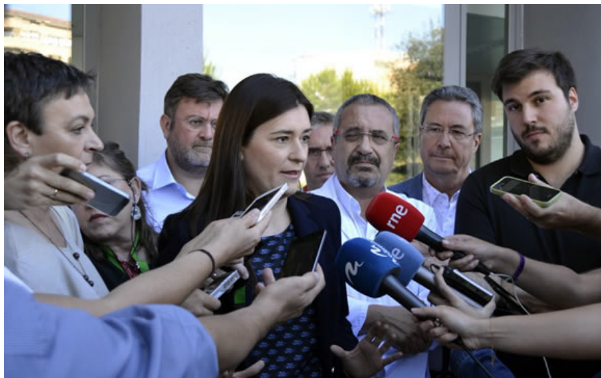
La consejera de Sanidad de Valencia, Carmen Montón.

El Cecova considera insuficiente las plazas reservadas para Enfermería en las oposiciones de 2016, mientras que el sindicato Satse critica que la Consejería de Sanidad no incluya a enfermeras especialistas en la estrategia de salud mental.