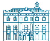
PALACIO DE COLOMINA