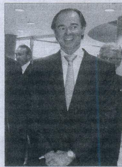
El conseller de Sanidad, Llombart.

había optado ya por impedir la utilización del vapeo para evitar problemas con los pacientes de los espacios de salud o los usuarios de los geriátricos. Por ello, el conseller precisó que su equipo estudia «tomar alguna medida en cuanto a la regulación de este producto en lugares donde la gente pueda ser más sensible a los perjuicios que, en su caso, pudiera causar, como pueden ser colegios, hospitales, centros de salud y residencias». Y añadió que «lo estamos meditando y posiblemente en breve, si no tenemos una norma básica que ampare a las comunidades, saquemos algo en esa línea».