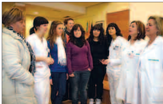
Imagen de archivo de un grupo de enfermeras y estudiantes de Enfermería.

El Colegio de Enfermería de Alicante ha recordado en un comunicado que ante la noticia publicada sobre una sentencia que afecta a las enfermeras del Servicio de Radiodiagnóstico del Hospital General Universitario de Alicante que en ningún caso dicha sentencia obliga a que estas profesionales deban ser retiradas del servicio. Según la institución colegial, lo que se hace en esta sentencia es instar a la Administración a que las enfermeras no realicen las funciones propias de los especialistas de Formación Profesional en técnica de imagen para radiodiagnóstico, salvo que tengan la especialidad reconocida o estén trabajando en servicios de radiodiagnóstico desde antes de 1989. Desde el Colegio de Enfermería de Alicante se incide en la obligatoriedad de que exista un profesional enfermero en todos aque-