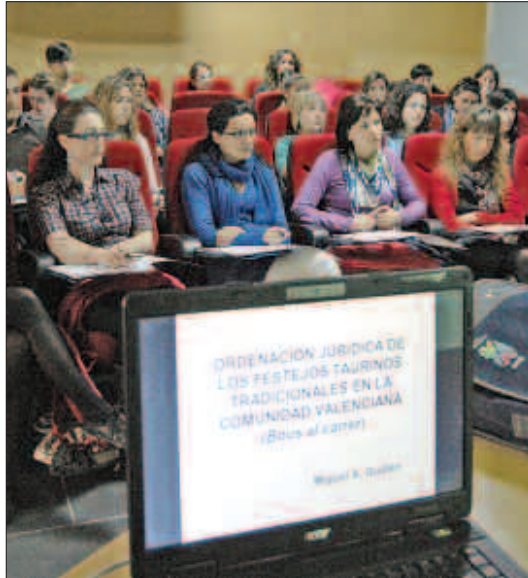
Alumnos en el primer día del curso organizado por el COECS.

El curso se inicia con un repaso a la legislación vigente en festejos taurinos tanto en plaza como