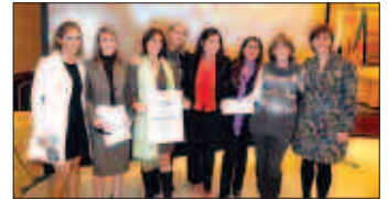
Imagen de archivo de 7 enfermeras del CECOVA

El Consejo de Enfermería de la Comunitat Valenciana (CECOVA) y los colegios de Enfermería de Valencia, Castellón y Alicante reclamaron en el Día Universal del Niño, el