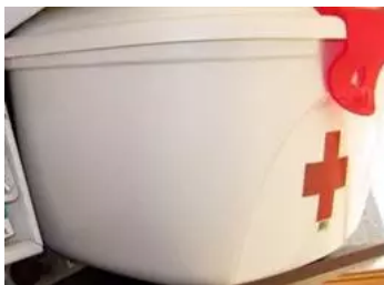
Imagen de archivo de un botiquín

El Cecova recurrió en 2018 la resolución al creer "un despropósito" que docentes "tengan responsabilidad de actuar ante una urgencia"